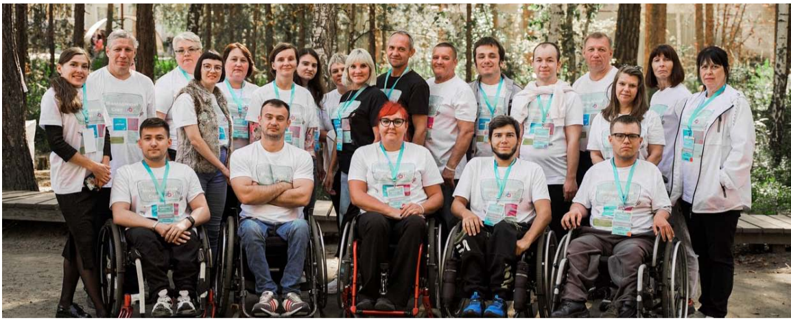
(Продолжение. Начало на 1-й стр.)

Помимо организаторов, планировавших и обеспечивавших проведение слета молодежного актива, главными действующими лицами его были спикеры выше-названных обучающих мини-курсов. Насколько они удовлетворены результатами короткого, но интенсивного учебного процесса?