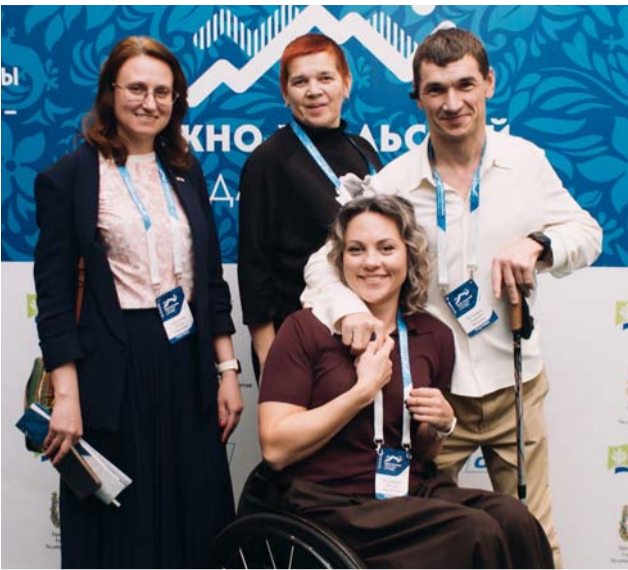
На форуме «Равные возможности»