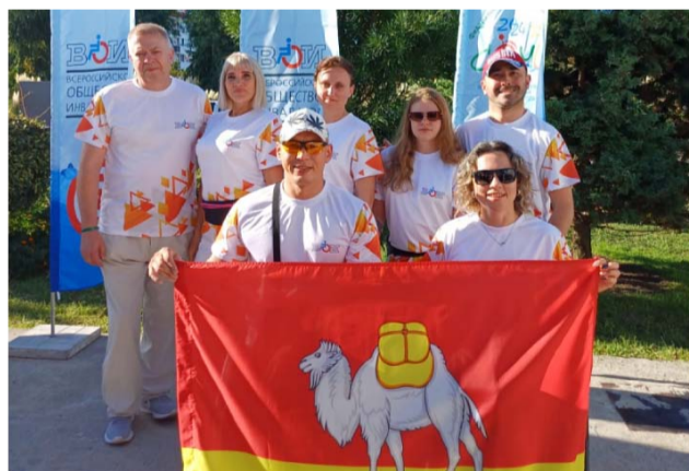
Команда ЧООО ВОИ на Всероссийском спортивном фестивале в Сочи

Эта работа будет подготовкой к отчетно-выборной кампании, которая начнется во второй половине 2025 года. Организации на местах могут уже сейчас собрать правление, утвердить дату конференции и проводить собрания в первичках, чтобы выбирать кандидатов для участия в ней. Сегодня на территории Челябинской области ведут свою работу 44 местные организации ВОИ, многие из них имеют статус юридического лица, поэтому у них есть возможность привлекать для проведения мероприятий дополнительные денежные средства через участие в различных грантовых конкурсах, трудоустраивать инвалидов через соглашения в рамках квотирования рабочих мест и так далее. И надо создавать, возвращать актив организаций, который бы мог воспользоваться этими возможностями для их развития.