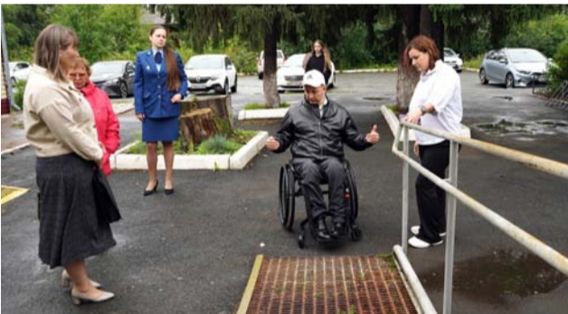
Мониторинг доступности в Снежинске

– Если коротко: держали на контроле. Продолжалась работа по обследованию доступности муниципальных социально значимых объектов с уполномоченным по правам человека, и наши председатели местных организаций ВОИ принимали в этом участие. Одновременно мы работали с прокуратурами, в том числе транспортной, по доступности железнодорожного, воздушного транспорта, автовокзалов. Взятые на контроль Генеральной прокуратурой проблемы инвалидов Челябинской области, связанные с доступностью электронных услуг РЖД, доступностью общественного транспорта, обозначенные нами на совместных встречах.