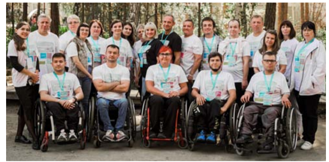
Слёт молодежного актива УрФО

– По предварительным планам – организация молодежного слета ВОИ УрФО. Традиционный межрегиональный слав в связи с увеличением количества организаций в Уральском МРС теперь будет чередоваться с интеллектуальными играми в Республике Башкортостан. Но наш, областной слав, причем без ограничений по возрасту, состоится, потому что желающих много, и необходимый инвентарь в организации имеется. Продолжим реализацию проекта по развитию туризма: будет работать секция скалолазания в центре спортивной реабилитации ЧООО ВОИ, секция по спортивному туризму, будем организовывать однодневные походы. Проведем и областной туристический слет. Ну и, конечно, никуда не уйдут наши традиционные зональные