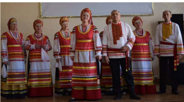
Фестиваль «Бабушкин лоскут»

В прошлом году начали работать над созданием регионального перечня технических средств реабилитации. Эта тема очень волнует людей с инвалидностью, поскольку в федеральном перечне есть далеко не всё, что жизненно необходимо инвалидам. Вопрос создания регионального перечня ТСР был поднят на заседании Общественного Совета по делам инвалидов при губернаторе Челябинской области и находится у него на личном контроле. Будем продолжать его прорабатывать совместно с уполномоченным по правам человека. По медицинскому обслуживанию и получению лекарственных препаратов мы проводили регулярные встречи представителей Минздрава с лидерами организаций ЧООО ВОИ по информированию